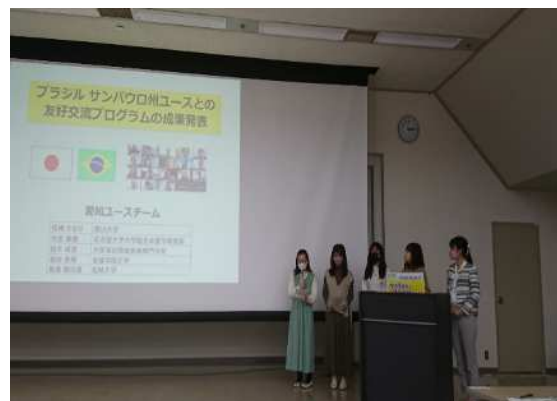
<「生物多様性と SDGs 多世代フォーラム」 での成果発表>