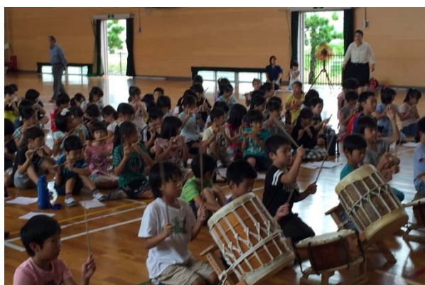
一宮市立瀬部小学校

後継者育成には、まず、子どもたちが地域に伝わる民俗芸能の奥深さを理解し、郷土を愛する気持ちを高めることが求められる。このため、地域の民俗芸能保存団体と交流できる環境を整備し、鑑賞に留まらず、体験・練習及び発表という継続的な伝承活動を支援した。