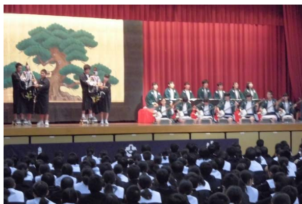
知立市立知立中学校