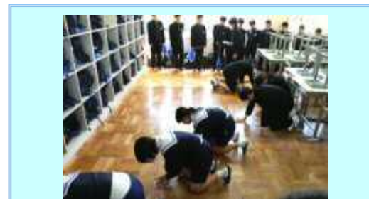
2016年4月15日（金） 無言清掃伝達式

体育館で、3年生の代表が無言清掃の意義を話した後、それぞれ教室で、無言清掃の方法を3年生が1年生に丁寧に伝えました。無言清掃は、こうして新たな〇〇中の伝統として受け継がれています。