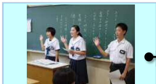
2016年9月5日（月） 生徒会プロジェクト「みんなで Say Hallo !!」スタート

体育館で、3年生の代表が無言清掃の意義を話した後、それぞれ教室で、無言清掃の方法を3年生が1年生に丁寧に伝えました。無言清掃は、こうして新たな〇〇中の伝統として受け継がれています。