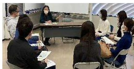
教室/ボランティアの個別面談