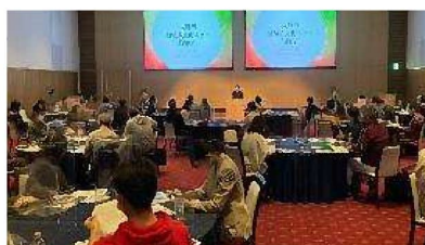
ボランティア研修