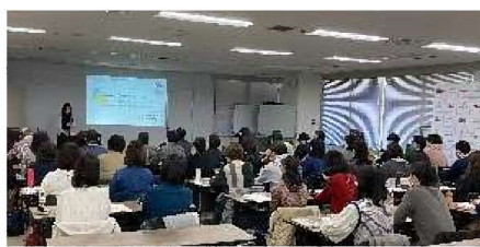
マッチングイベント