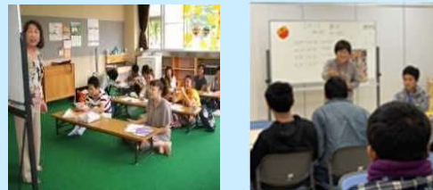
(文化庁委託事業による地域の日本語教室の例)