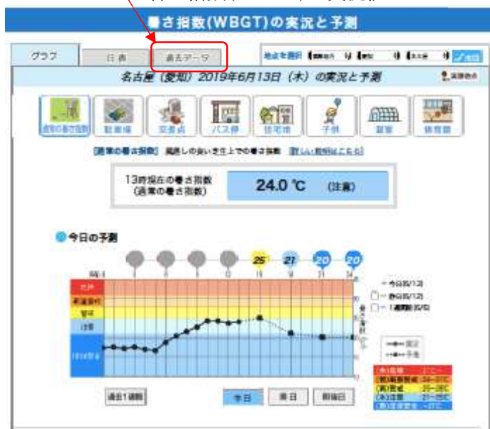
暑さ指数(WBGT)の実況値