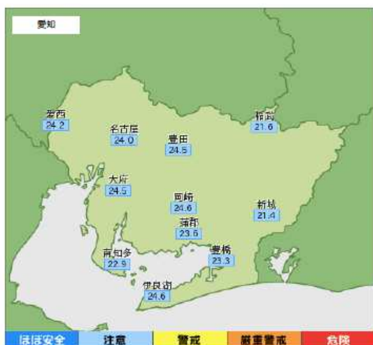
環境省が公表している観測地点