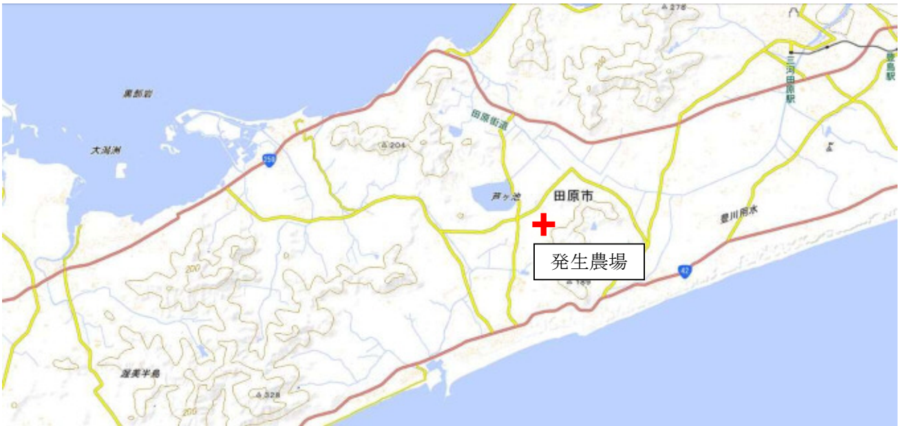
【発生農場の位置関係図】