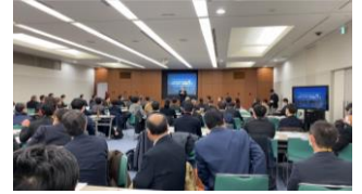
プロジェクトチーム合同会議の様子

2022年3月に策定した「あいちサーキュラーエコノミー推進プラン」に基づき、サーキュラーエコノミー（循環経済）への転換とプラスチックや太陽光パネル等の社会的課題を同時に解決するため、7つのサーキュラーエコノミー推進プロジェクトチームを設立し、事業化を目指した取組を実施している。