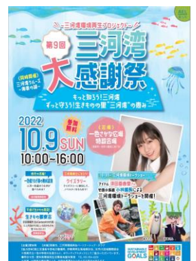
2022年度三河湾大感謝祭