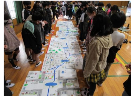
環境学習の様子 (安城市立安城西部小学校)