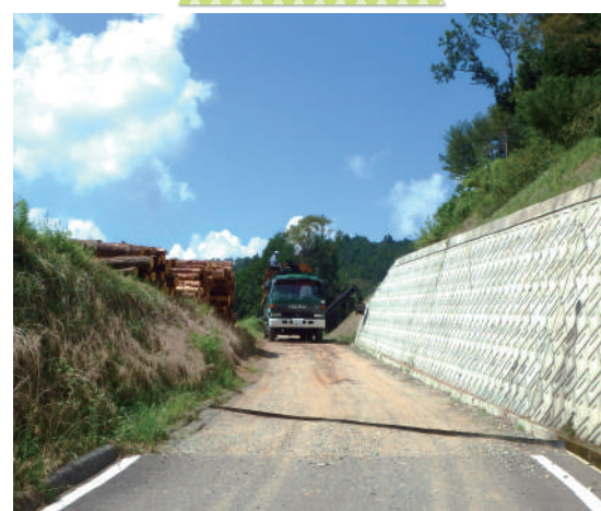
たひらざわひらせせん 豊田市 田平沢平瀬線