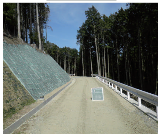
わだたしろ せん 新城市 和田田代線