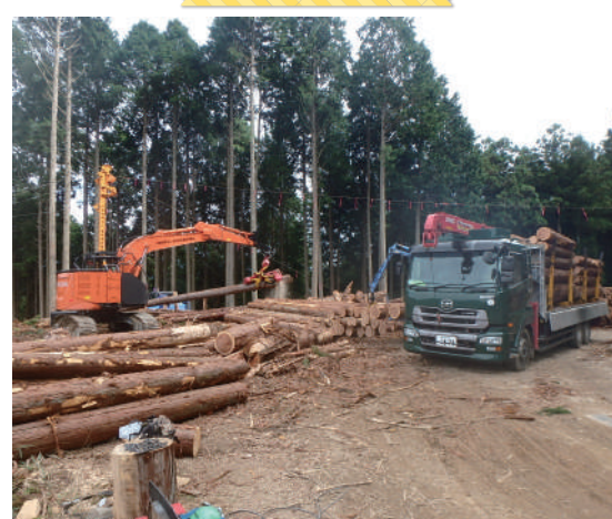
まきのかみくろかわしせん1ごう 豊根村 牧野上黒川支線1号