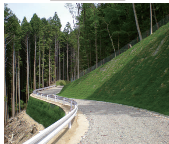
にしそのめみそのせん 東栄町 西菌目御園線