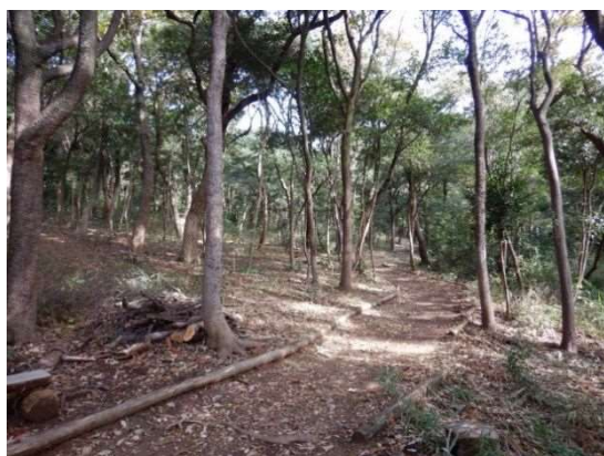
林内整理後の状況