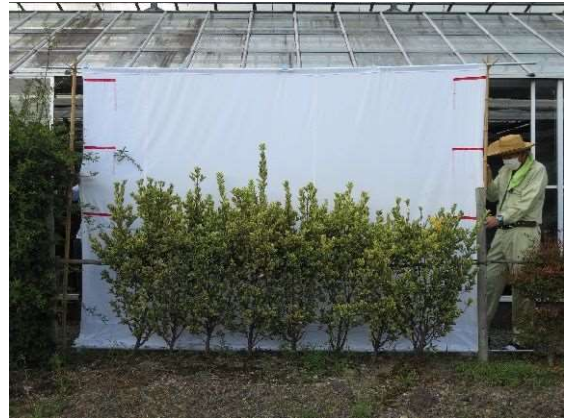
調査研究業務 樹種特性を生かした生垣作り