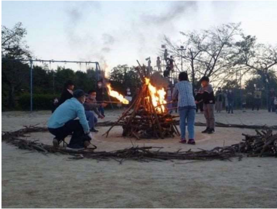
間伐した木でキャンプファイヤー