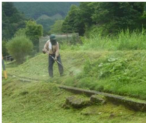
「上古戸地区環境保全会」 草刈り