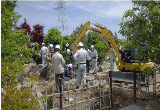
基礎講座 「造園技能コース」