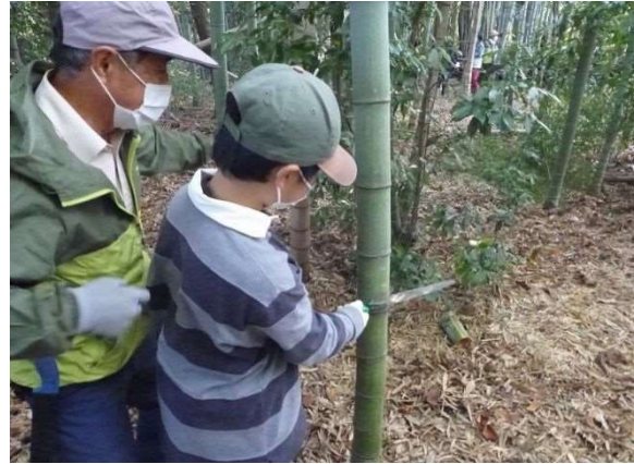
竹の切り出し作業