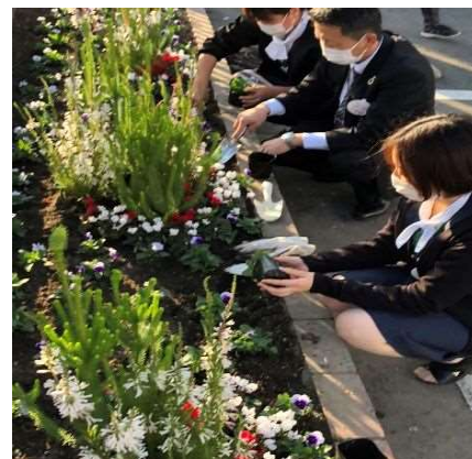
東春信用金庫篠岡支店