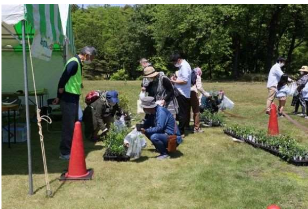
みどりフェスティバル2022春・秋での緑化木配布

2022年度、春及び秋の緑化強調期間等に県内各地で8,063本の緑化木を配布し、多くの県民の皆さまに対して、緑化の普及啓発を行いました。