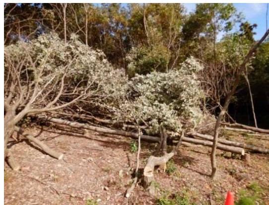
コナラ林(20年生)の伐採状況