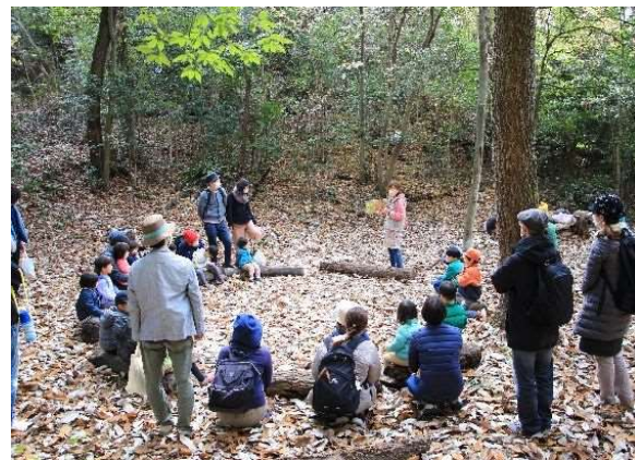
海上の森キッズアカデミー （森のようちえん）