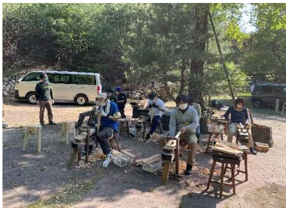
グリーンウッドワーク講座 （スツールづくり）