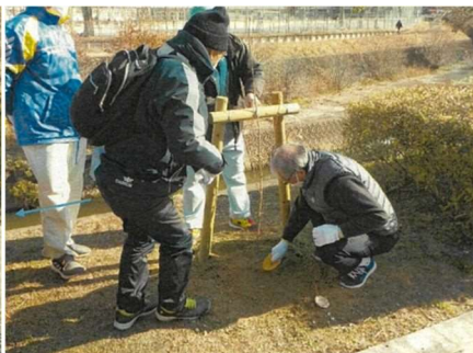
植樹（新池田橋上流）