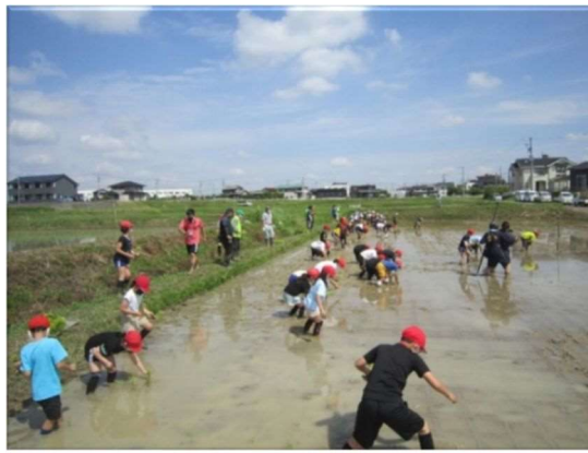
「中根みどり保全会」 田植え体験授業