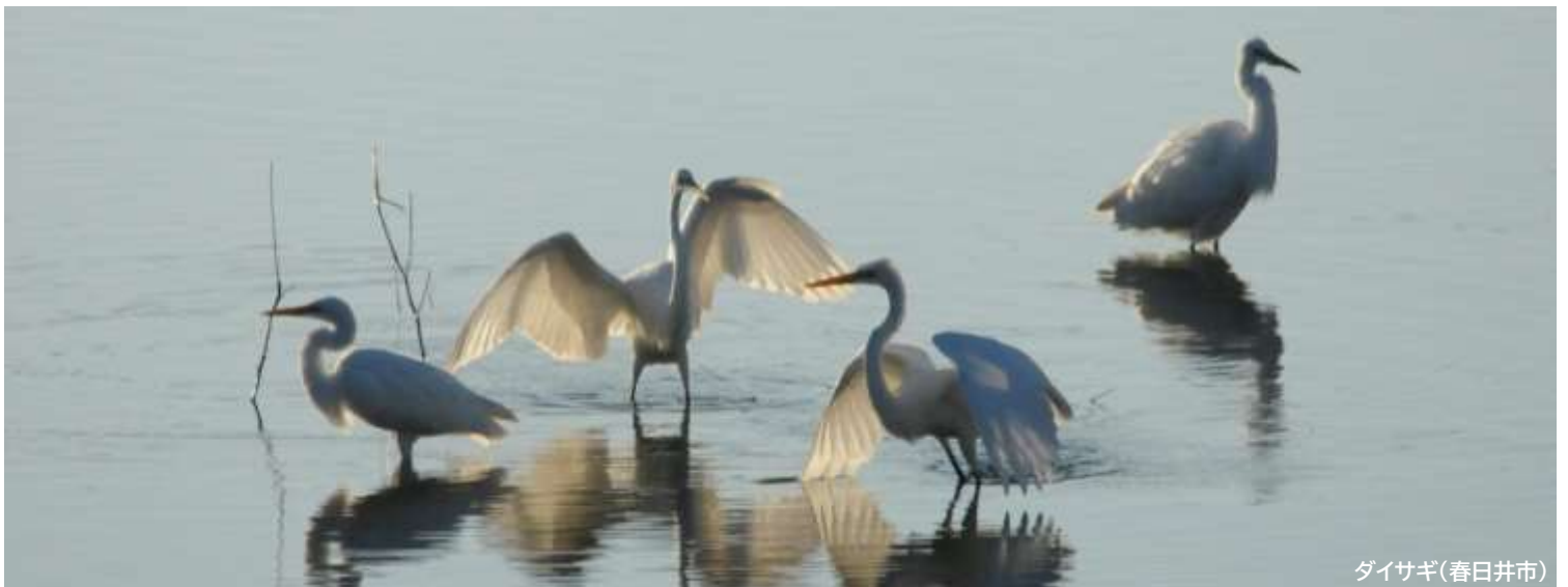
ダイサギ(春日井市)