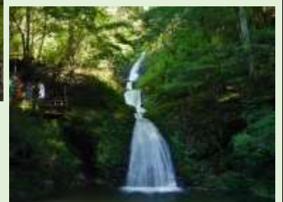
阿寺の七滝(新城市)