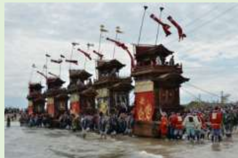
亀崎潮干祭(半田市)