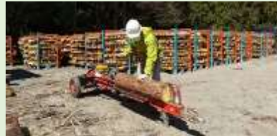
上左:キャベツ 上中:洋らん 上右:うずら卵 下:間伐材の薪への加工(新城市)