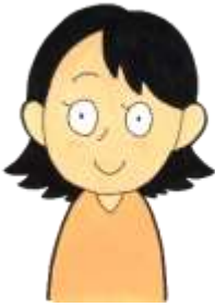
旅行が好きな お母さん