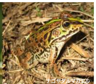
ナゴヤダルマガエル