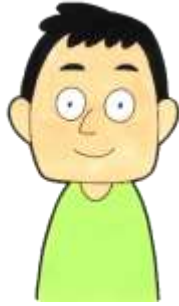
いろいろ作ることが 好きなお父さん