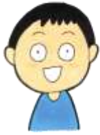
生きもの好きな 男の子