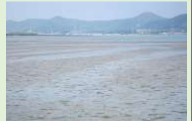
汐川干潟 (豊橋市、田原市)