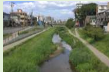
多自然川づくり (矢作川系伊賀川:岡崎市)