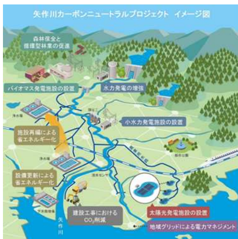
矢作川カーボンニュートラルプロジェクトのイメージ図