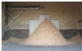
製材端材を利用した製紙用チップ