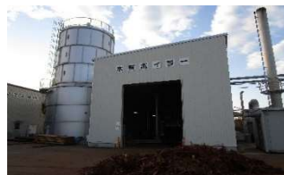
木材乾燥機の熱源となる木くずボイラー