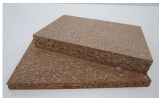
パーティクルボード

低質材や製材端材、住宅材料等の廃棄物を別の用途に再利用するカスケード（多段階）利用を促進。