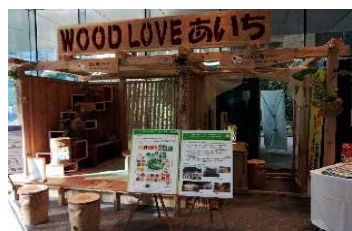
県産木材製品等の展示