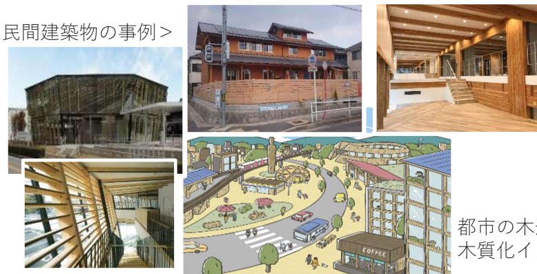
都市の木造・木質化イメージ