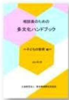
子どもの教育編 (2021年3月発行)

外国人住民がより充実した行政サービスを受けることができるようにするため、当協会に寄せられた相談事例をもとに、外国人特有の問題やその背景となる各国事情、相談対応のポイント等を含めた相談対応冊子を作成し、市町村・市町村国際交流協会、社会福祉関係機関等の相談窓口へ配布する。