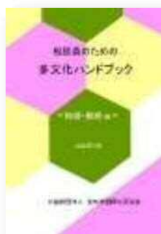
結婚・離婚編 (2020年3月発行)