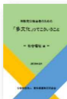
社会福祉編 (2018年2月発行)