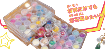
材料だけでも 飾り作りたい!

ひつよう ざいりょう し い つく さくひん せん 必要な材料の仕入れや、作った作品の宣 伝、販売など、スマートフォン1台とネット環 境があれば誰でも今すぐ始められる仕事 だよ。やってみよう! その1歩が大切なのだ!