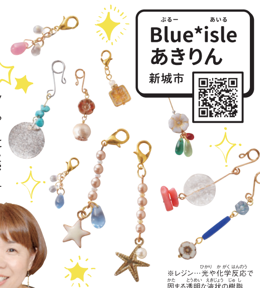
※レジン…光や化学反応で固まる透明な液状の樹脂

自宅をアトリエに、自分のペースで 仕事ができるので、家事・育児を しながら活動できます!