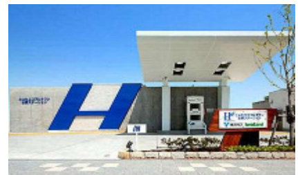
とよたエコフルタウン水素ステーション