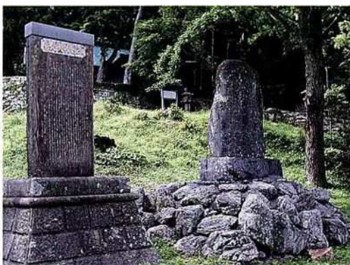
八幡宮神社の境内に建てられた頌徳碑

このような決意で臨んだ逐詰の割 り当てを具体的にみると表VIにある ように①の大垣（地図Ⅱ参照）の場 合には、豊崎郷と佐護郷より作業可 能な一〇六二人（給人・足軽を含 む）中六〇〇人を選び、八日間の日 数を割り当て、のべ四八〇〇人が逐 詰を行う。以下の大垣も同じように 見積もり、総計で五万二八〇〇人の 人夫を動員し、食料は、三六九石六 斗が必要であると算出している。こ のようにして、一連の猪鹿逐詰に動 員が予定された総人数は、二十二万 九七七〇人となり、総食料数は、一 六〇三石三斗五升にも及ぶ。この計 画書の中には、さらに、猪鹿逐詰の 作業をどの時期に行うかという具体 的な事柄も盛り込まれている。