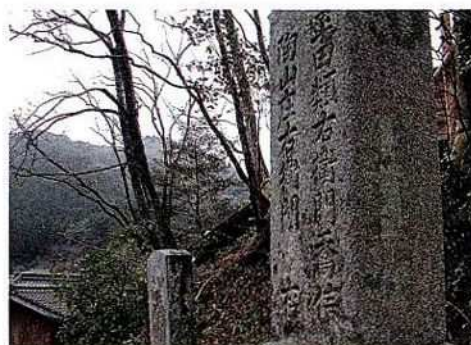
佐護の金倉壇にある曠古遺愛の碑

国のことよく知る人の なかりせば なか建てなんこの碑を 文化九壬申年六月 戸田頼母源暢明