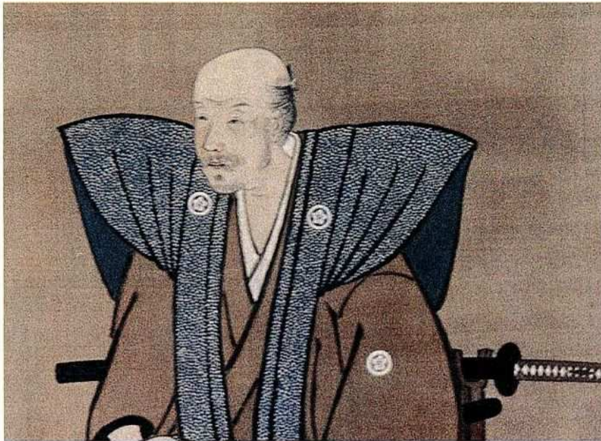
陶山訥庵先生肖像

編集・発行 長崎県立対馬歴史民俗資料館 対馬市厳原町今屋敷 郵便番号 817-0021 電話 (0920) 52-3687 印刷所 諫早市長野町1007-2 (株) 昭和堂 電話 (0957) 22-6000