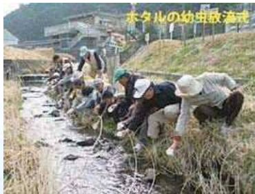
ホタルの幼虫放流

ホタルシーズンである6月にホタルまつりを開催したり、鳥川の森林や水の恵みを体感してもらうための山歩きイベントを開催しています。