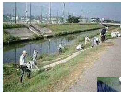
稗田川の草取り・清掃活動