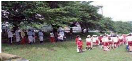
御油小学校と クリーン活動

会員の啓発活動を推進するために、会員や地域住民を対象に環境保全に関する研修会を開催しています。