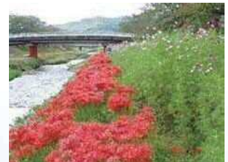
コスモスと彼岸花