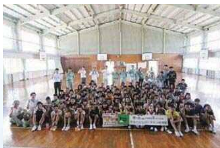
教室の空気はビタミン材運動 集合写真