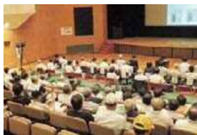
平成25年美浜町の講演会 (美浜町総合公園体育館)