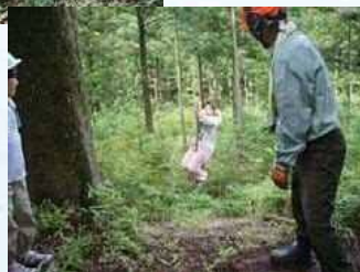
森遊び(ターザンロープ)