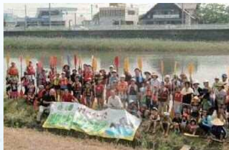
カヌー体験の集合写真