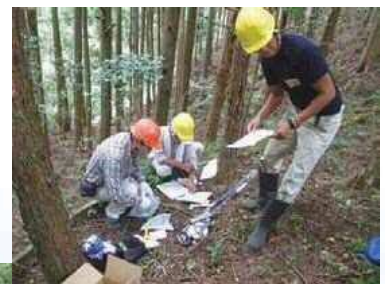
山仕事仲間の養成講座