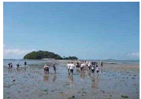
前島へは歩いて渡れます