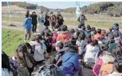
小学生に水質と 生物の説明