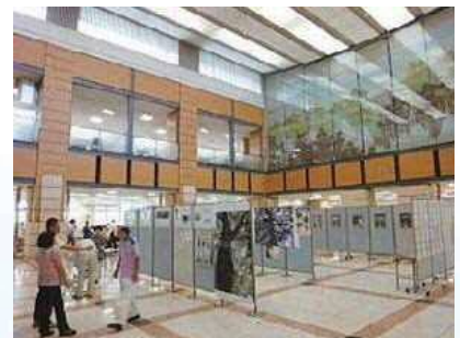
活動写真展(碧南市役所ロビー)