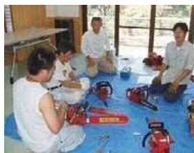
チェンソー講習会