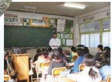
小学校への訪問講座