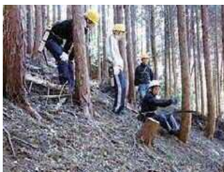
森林整備の体験講座

会員間や関係団体との交流・情報交換と会の活動報告も兼ねる定期的な交流会を開催しています。また、活動状況や森林に関する情報を発信する機関誌「フォレスト」を年4回発行しています。