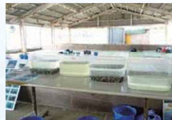
アサリの浄化実験