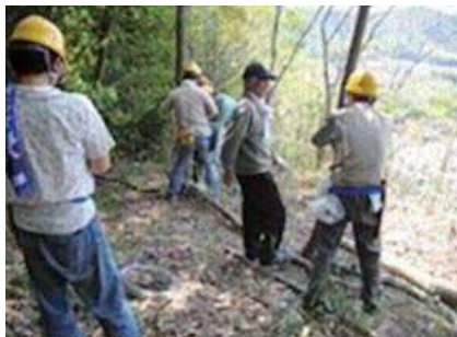
蛍流の森整備保全活動