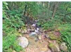
水源の森 購入予定地