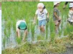
田んぼの生き物採集