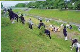
地域住民とともに草刈り