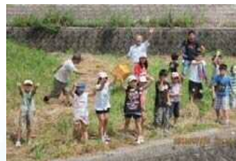
矢勝川の浄化活動に 歓声をあげ大喜びの 子供達