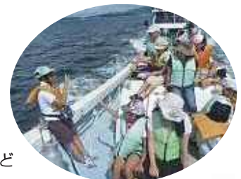
スナメリウォッチング