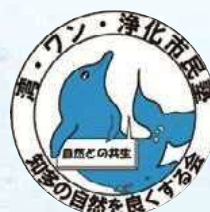
シンボルマーク (知多半島はイルカに 抱かれています)