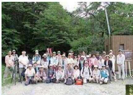
エコツアー集合写真

生ゴミの排出を減らすことを目的に、毎年市民に生ゴミ処理のアンケートと「土のう式生ゴミ処理」のモニターになってもらいその結果を参考にし、改善および普及に努めています。