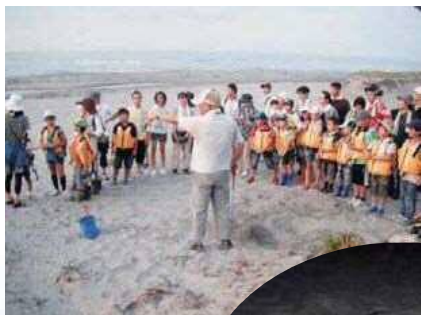
自然観察会の様子