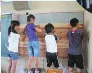
小学生が杉板を張る作業