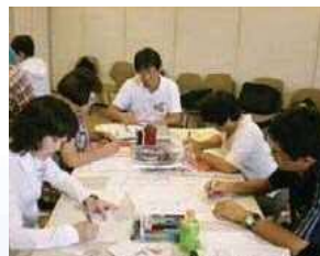
木と森を学ぶワークショップ