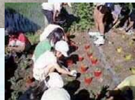
児童たちの花壇手入れ