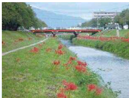
佐奈川に咲く彼岸花

PTAを含めた幅広い教育関係者、町内会を含めた地域社会、さらには老人福祉施設、行政との連携を河川環境改善活動を柱とした上でさらに深く、さらに広げていくために、地道な話し合いと調査研究を続けています。