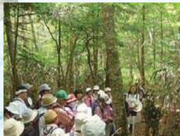
エコツアーによる樹木観察