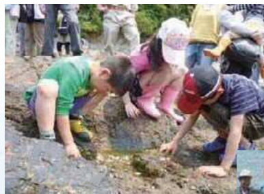
干潟・磯の生き物観察会

学校、行政等の依頼があった場合、自然観察会に講師の派遣を行っています。行政等の依頼があった場合、東三河地域の自然環境調査を連携・協働して行っています。