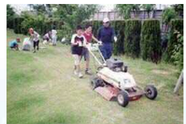
公園の芝刈り&整備活動