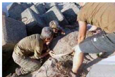
砂浜再生プロジェクト