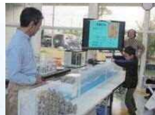
海の環境に関する講座