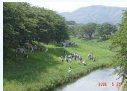
音羽川で遊ぶ子供たち