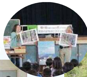
山や木についての勉強会