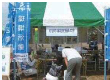
イベントでの啓発活動