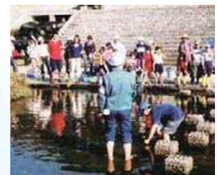
ピオトープづくり