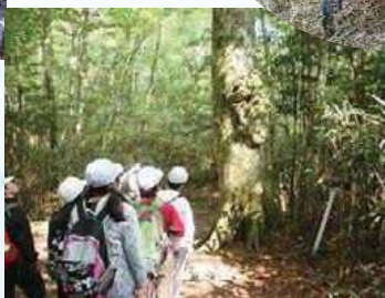
小学生の森林体験