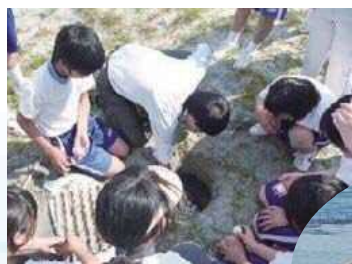
ウミガメの生態調査