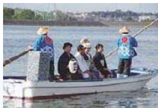
渡し場まつりの嫁入り船