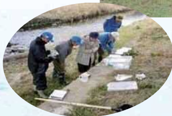
音羽川の水質調査