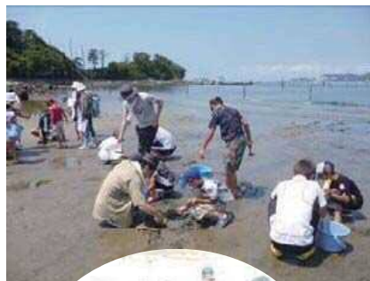
干潟の生き物採取

前島(無人島)で干潟の体験学習や、自然観察会を開催しています。干潟に生息する生き物の採取を通して、海の浄化には干潟が重要であることや、多くの生物が生息していることを学びます。