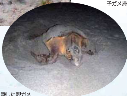
産卵のため上陸した親ガメ