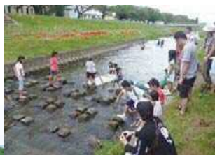
子供たちの川遊び