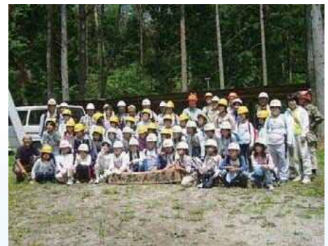
のびっこ森林隊集合写真