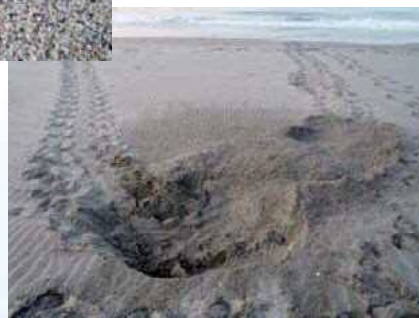
上陸・産卵後の足跡