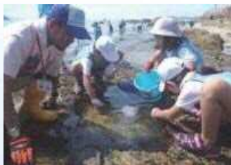
干潟に生息する生物探し