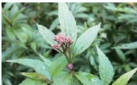
ホタルの里のフジバカマ