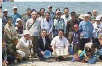
大村知事を囲んで集合写真