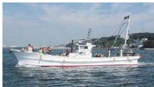
底引き網による生き物とゴミの調査