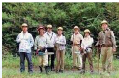
エコネットチェンソーズ

市内の河川や堤防を生態系豊かで親しみの持てる状態にするために、半場川クリーン活動、水質調査や水生生物等の環境学習講座などを行っています。