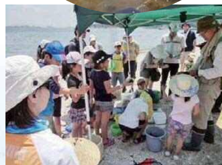
磯に棲息する生き物観察