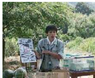
採取した生き物の解説