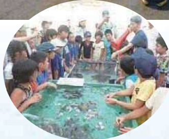
干潟の生き物の解説