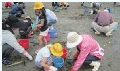
山の子潮干狩り招待