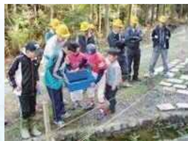
ホタルの幼虫の放流