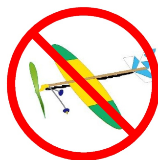
模型航空機の飛行 (ゴム動力機など)