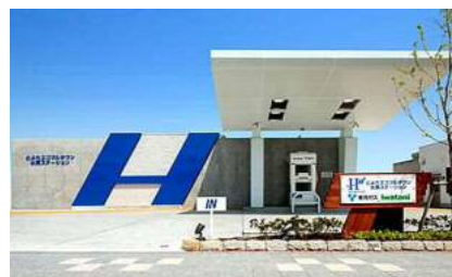
とよたエコフルタウン水素ステーション