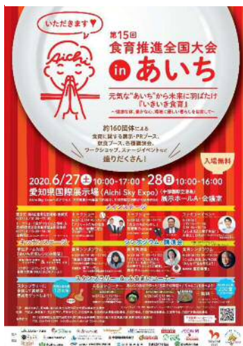
図4 チラシ案 (A4・両面)