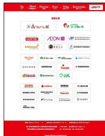
図11 協賛企業 (大会ホームページで紹介)