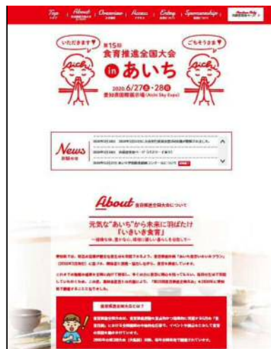
図5 大会公式ホームページ抜粋