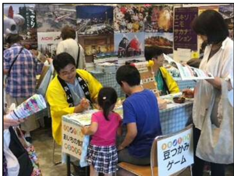
図6 愛知県（次期開催地）ブース及び引継式の様子

2019年6月29日（土）、30日（日）に山梨県甲府市で開催された、「第14回食育推進全国大会 in やまなし」に次期開催地として出展し、来場者及び出展者へ愛知県大会の開催についてPRするとともに、大会開催の様子について視察した。