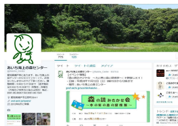
写真13 海上の森センターfacebookページ