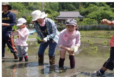
写真6 里と森の教室