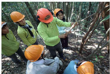
写真11 森女養成講座