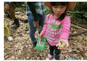
写真9 森の保育者養成講座①