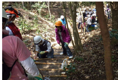
写真1 CKDによる丸太階段の補修