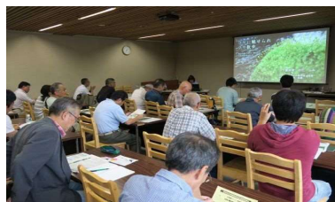
写真12 ミニセミナー