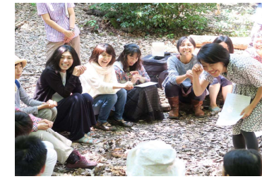
写真10 森の保育者養成講座②