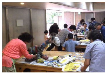
写真8 フォーラム助成団体の活動