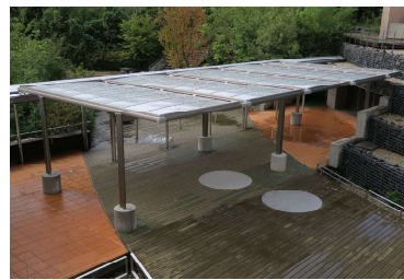
写真15 ウッドデッキ屋根工事(竣工)