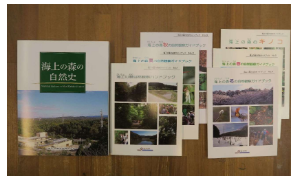
写真14 有償頒布図書