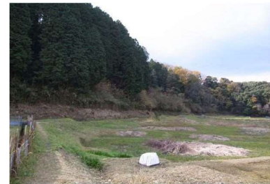
写真4 休耕田の状況