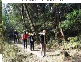
【保全活動】 (伐採木搬出)