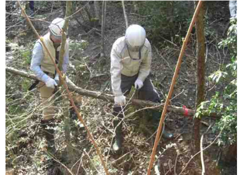
シデコブシ保全活動

今後も保全活動を実施し、名古屋大学の指導・助言をもとにシデコブシの保全に努めていく。