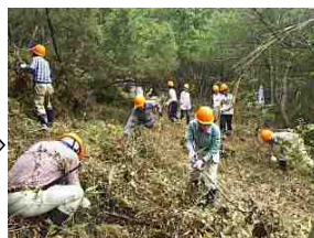
【保全活動】 (ササ・除伐木の整理状況)