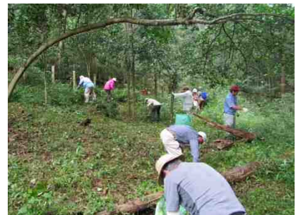
スミレサイシン保全活動

今後も保全活動を実施し、植物分野の専門家の指導・助言を得ながらスミレサイシンの保全に努めていく。