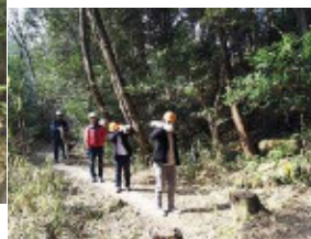
【保全活動】 （伐採木搬出）