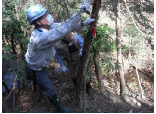
シデコブシ保全活動

今後も保全活動を実施し、名古屋大学の指導・助言のもとにシデコブシの保全に努めていく。 なお、シデコブシの生育状況については別紙 1 のとおり。