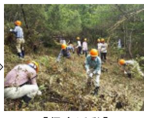
【保全活動】 （ササ・除伐木の整理状況）