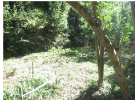
スミレサイシン保全活動