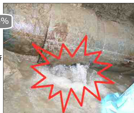
石綿セメント管 破損状況