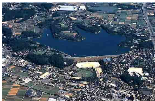
耐震対策を行う三好池(みよし市)

さらに、木曾川用水や矢作川用水についても、計画的に耐震対策や老朽化対策等の事業化を図る必要があり、経年劣化の著しい宮田用水幹線