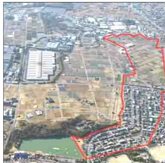
堤体決壊時の想定被害区域 保田ヶ池(みよし市)