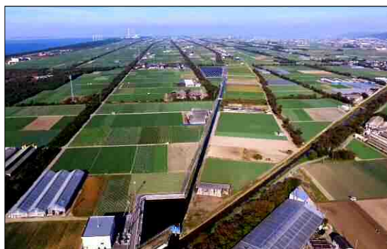
高収益作物(キャベツ)の作付状況(田原市)