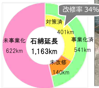
県内の対策状況(H29 調査)