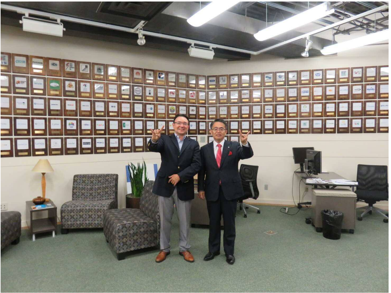
ATI が支援して成功した企業のプレートが並ぶ前で、アラニス副社長と。