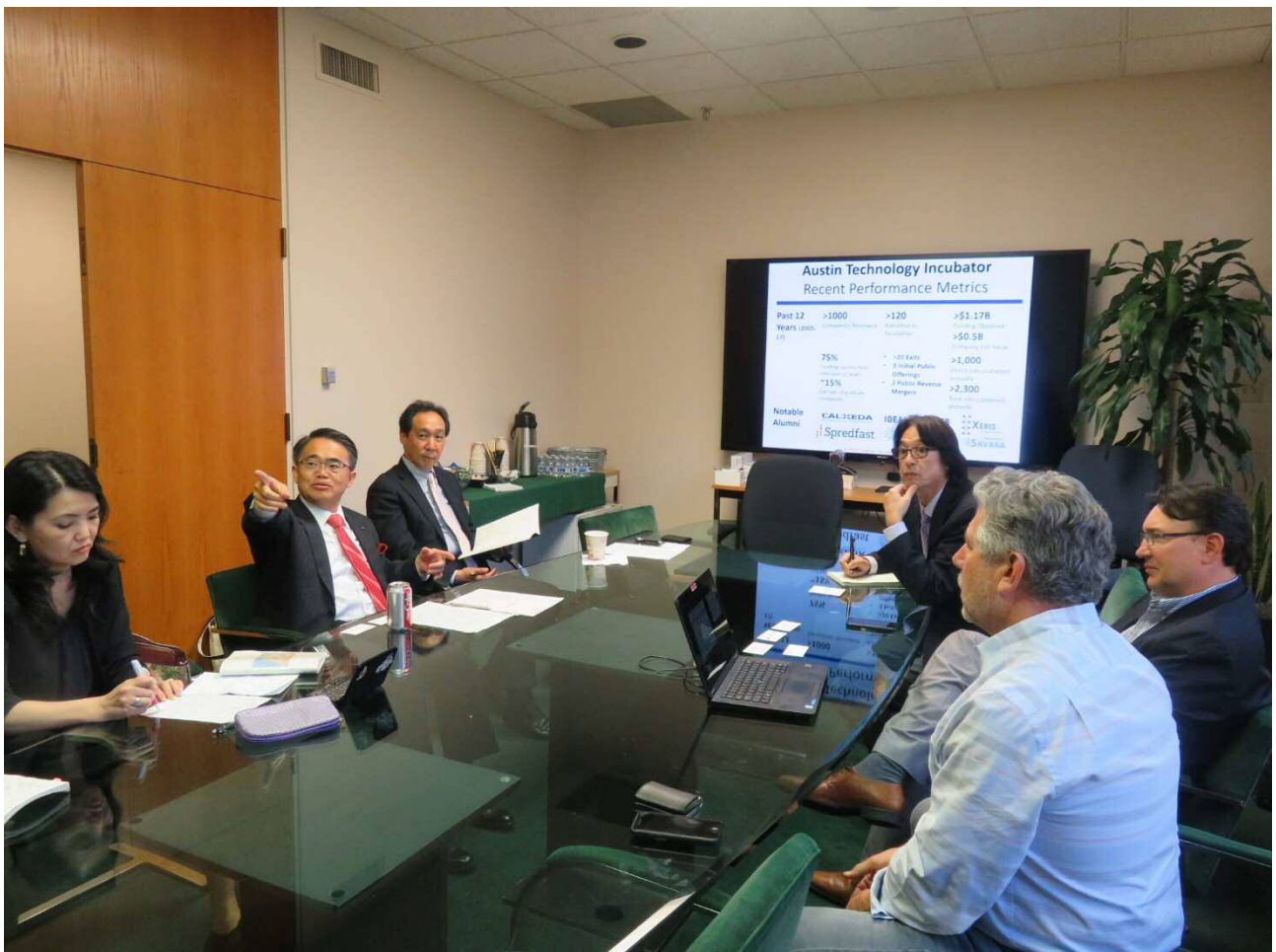
説明を受ける様子

オースティン・テクノロジー・インキュベーター (ATI) より、団体設立の経緯やスタートアップ企業に対する支援内容、支援対象の変遷、インキュベーターの役割、最近の動向等について説明を受けた。主な内容として、ATIは当初IoTやVRなどハイテクノロジー分野のスタートアップ企業を支援していたが、近年は同分野のスタートアップ企業を支援する団体が増えたため、現在はクリーンテクノロジー、バイオテクノロジー及びライフサイエンスといった分野に特化していることや、韓国の京畿道など海外の地方政府とも提携してノウハウの提供等を行っていることなどについて説明があった。