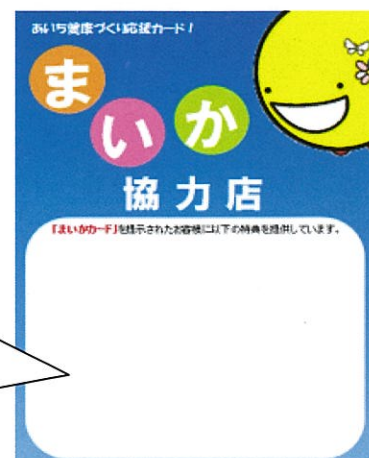
「協力店認定ステッカー」