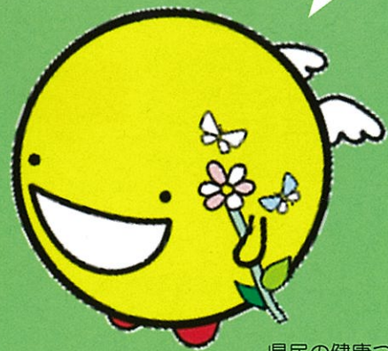
県民の健康づくりを応援する イメージキャラクター エアフィー