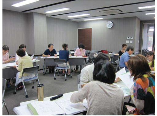
「起業の学校」授業風景