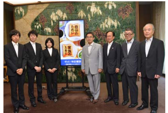
デジタルサイネージ広告披露で知事公館訪問