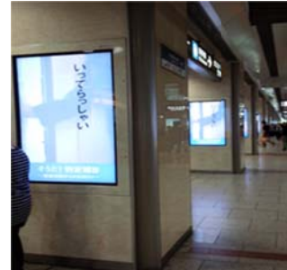
JR名古屋駅デジタルサイネージ