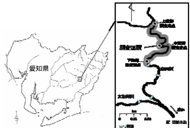
図 1 調査河川及び調査区間

島田川に流程約 2.0km の調査区間を設定し, さらに調査区間の上流部, 中流部及び下流部に調査定点を定めた (図 1)。西本 1) によると 1月中旬に卵からふ化したコイズミエグリトビケラの幼虫は, 成長に伴い流れの速い流心部で付着藻類を摂餌し, 7月には流心部付近の岩盤に集まり休眠を開始するとされている。このため, コイズミエグリトビケラの活動期における 2008年3月から同年7月まで毎月1回, 各調査定点の早瀬 (流れの速い流心部) においてサーバーネット (25cm×25cm のコドラート) を用いて底生生物サンプルを採集した。サンプルは採集後直ちに 99.5%エタノールで固定した。このサンプルが