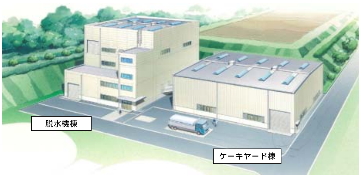
落札者の提案イメージ図（知多浄水場外観パース図）