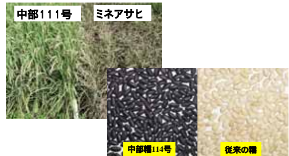
いもち病に強い中山間地向き水稻「中部111号」と赤色みりんの醸造に適した「中部糯114号」を開発 (農林水産省指定試験事業による成果)