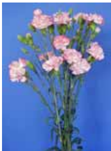
白地に赤い縁取りで品質の優れたスプレーカーネーション「カーネ愛知3号」を開発