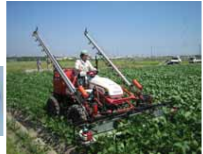
高能率摘心機を利用した大豆の増収技術を開発