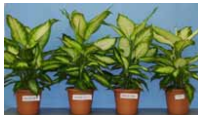
観葉植物栽培の重油代を低減する省エネ栽培技術を開発