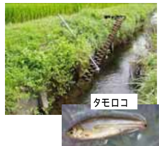
水田に棲む貴重な生物の保全・再生する水利施設の管理法を開発 (先端技術を活用した農林水産研究高度化事業による成果)