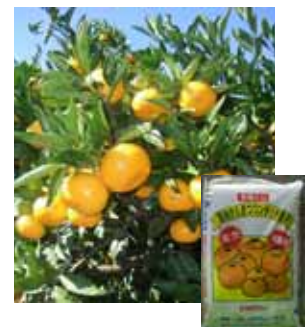
温州ミカンの肥効調節型肥料を開発