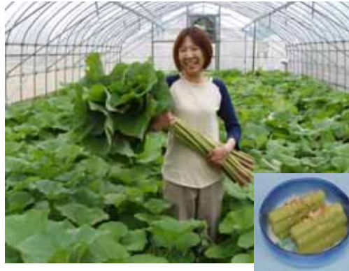
日持ちが良く、鮮やかな緑色をしたフキの新品種「愛経2号」を開発 (共同研究機関:愛知県経済農業協同組合連合会)