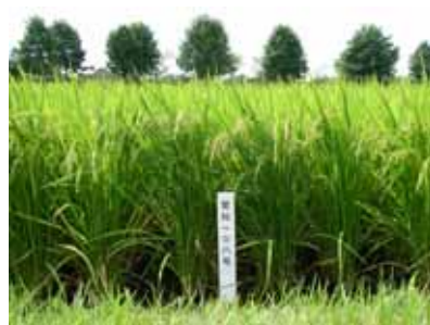
病害虫に強く、食味の良い水稻新品種「愛知108号」を開発