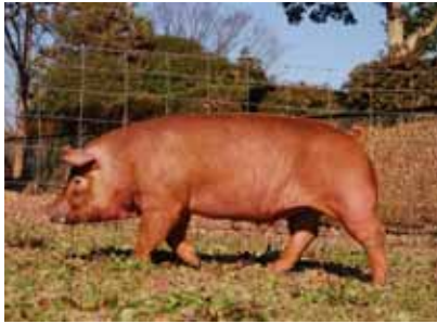
高品質で安定した豚肉が生産できるデュロック種の新系統豚「アイリスナガラ」を開発 (共同研究機関:岐阜県畜産研究所)