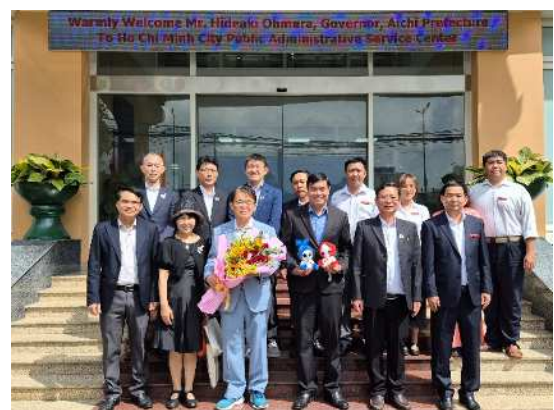
面談出席者との集合写真