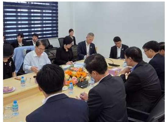
アイン センター長との面談の様子