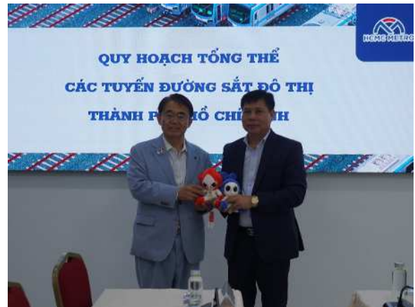
バン委員長とアジア・アジアパラ競技大会公式マスコット「ホノホン・ウズミン」