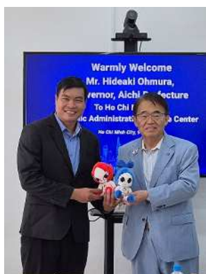
アイン センター長とアジア・アジアパラ競技公式マスコット「ホノホン・ウズミン」