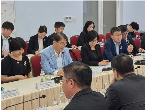
バン委員長との面談の様子