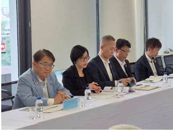
ホーチミン市科学技術局との面談の様子

最後に大村知事から、「また具体的に協力できることがあれば、連絡いただけたらと思う。」と述べ、面談を締めくくりました。