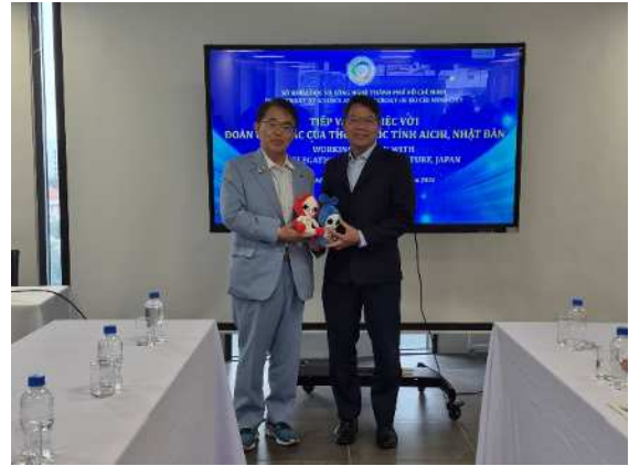
タン局長とアジア・アジアパラ競技大会公式マスコット「ホノホン・ウズミン」