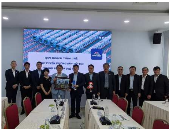
面談出席者との記念撮影