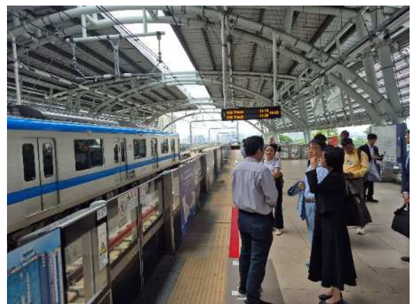
メトロ1号線を視察する 大村知事