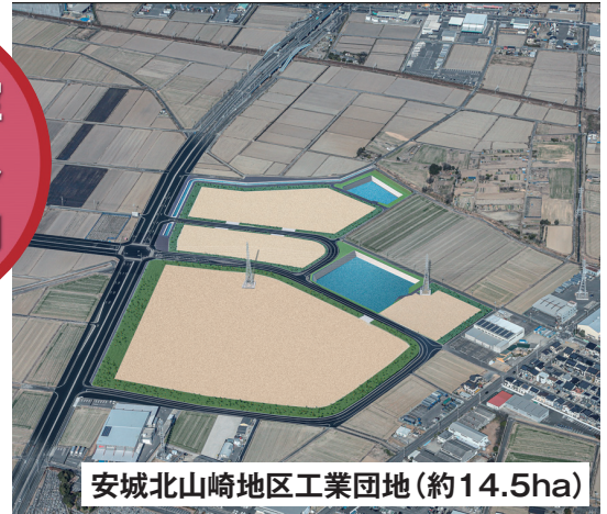
安城北山崎地区工業団地(約14.5ha)

市内企業の流出抑制と新たな産業を誘致するため、安城北山崎地区工業団地の開発を行っています。