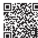
安城市へ立地する魅力