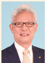
刈谷市長 稲垣 武

刈谷市は愛知県のほぼ中央に位置し、西三河平野西部にある衣浦湾へ注ぐ逢妻川の下流に面しています。江戸時代には、刈谷藩の城下町として発展し、大正末期にはトヨタ系企業の誘致により近代産業都市としての足がかりを得るとともに、現在においても市の中央部には最先端技術を駆使した自動車関連産業の工場が並び、活気に満ちあふれています。