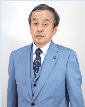
大府市長 岡村秀人