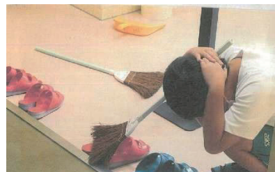
↑岡崎市立下山小学校でのシェイクアウトの様子(2022年)