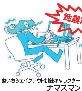
あいちシェイクアウト訓練キャラクター ナマズマン