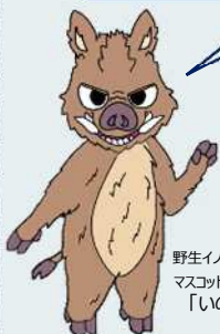
野生イノシシ対策室 マスコットキャラクター 「いのべえ」

QRコードを読み取ると、愛知県のWebページで血液検体採取停止期間が見られるべえ！