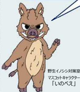
野生イノシシ対策室 マスコットキャラクター 「いのべえ」

QRコードを読み取ると、愛知県のWebページで血液検体採取停止期間が見られるべえ！