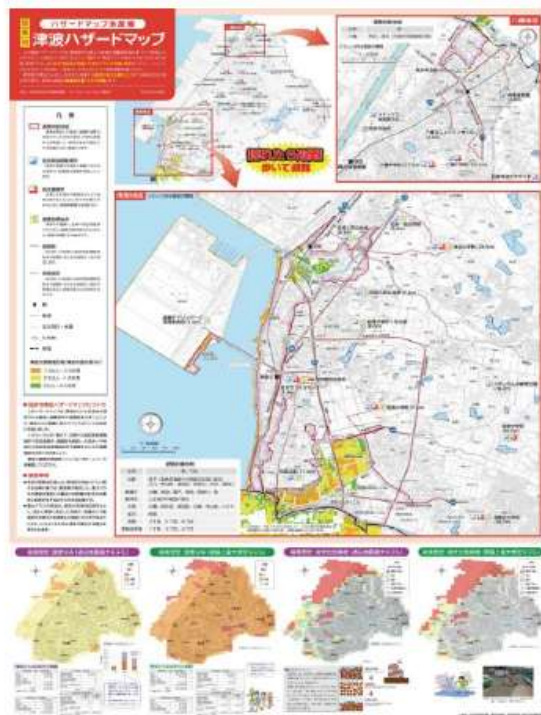
▲ハザードマップ地震編

台風や豪雨などの風水害により浸水の恐れがある地域、指定避難所などを掲載 (高潮、洪水災害に係る浸水想定、土砂災害警戒区域など)