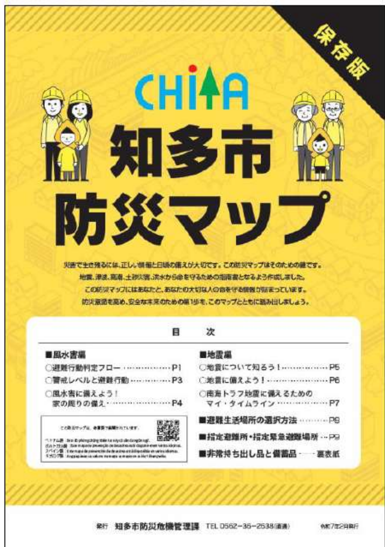
▲知多市防災マップ表紙