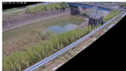
河川カメラ【稗田川】(YouTube)(外部リンク)