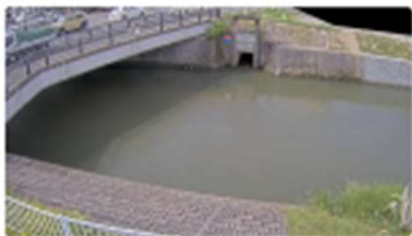
河川カメラ【神戸川】(YouTube)(外部リンク)