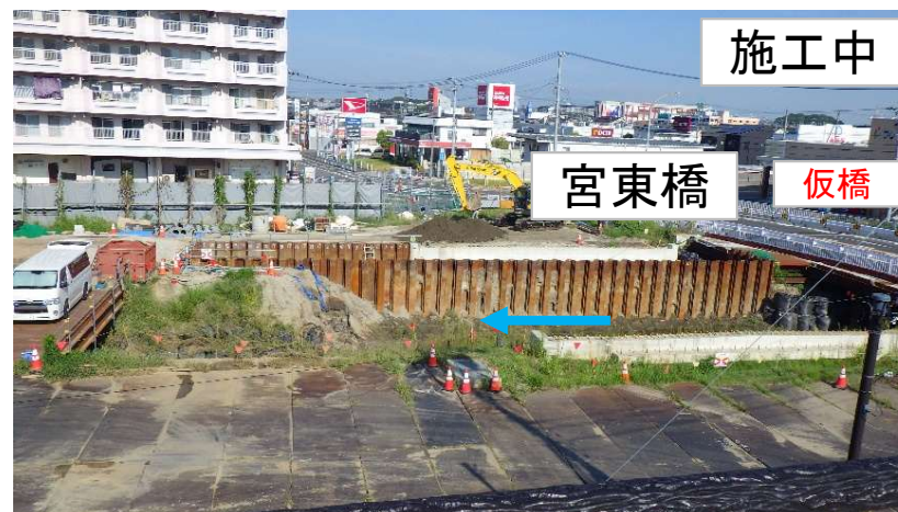
二の沢川(河道拡幅工事) ※県道蒲郡碧南線 宮東橋の架替え