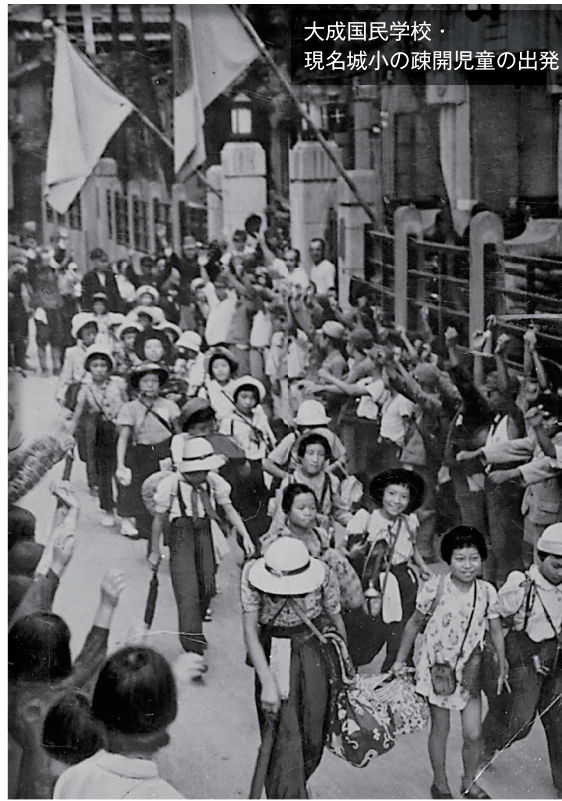
大成国民学校・ 現名城小の疎開児童の出発