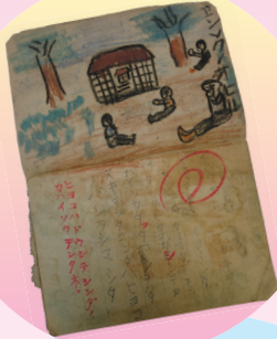
ナツヤスミエニツキ (当館所蔵)

戦争が育ち盛りの子どもたち にどのような爪痕を残したのか、 子どもたちの日記や戦後に書か れた回想記などに基づいてたど ります。