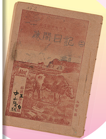
疎開日記 (名古屋市博物館所蔵)