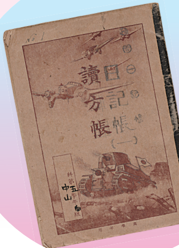
疎開日記 (名古屋市博物館所蔵)