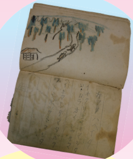
ナツヤスミエニツキ (当館所蔵)