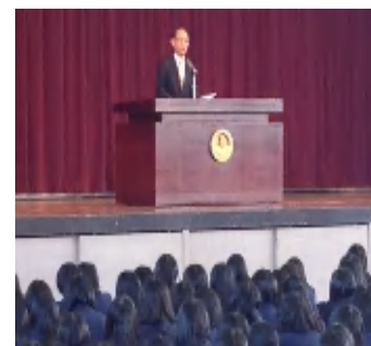
[学校主催キャンペーンへの参加]

教育キャンペーンを始めとする、県教育委員会が主催するイベント等に、教育委員が積極的に参加することにより、県民の目に見えるような教育委員の活動を実施することができた。