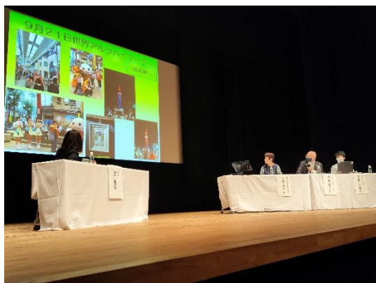
【県民フォーラムの様子】

https://www.youtube.com/watch?v=2qOZSjLwn4Q