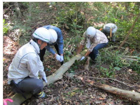
シデコブシ保全活動

今後も保全活動を実施し、名古屋大学の指導・助言のもとにシデコブシの保全に努めていく。