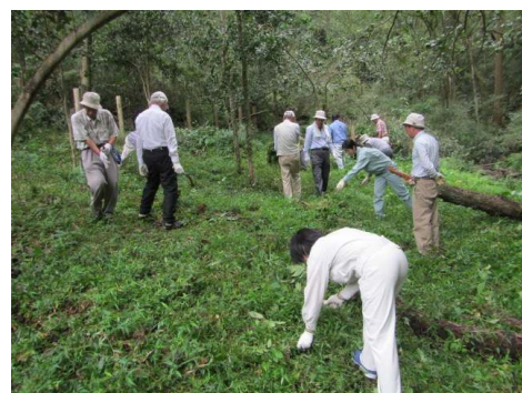
スミレサイシン保全活動

今後も保全活動を実施し、植物分野の専門家の指導・助言のもとにスミレサイシンの保全に努めていく。