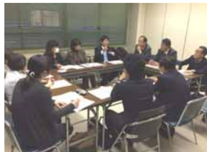
【学校支援協議会で構成するサポートメンバー会議の様子】