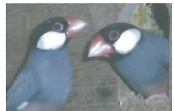
どっちがめでどっちが早かな?