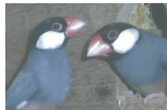
どっちがめでどっちが早かな？