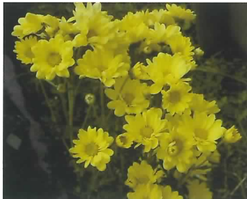
中山間地で栽培される色鮮やかな「小ギク」

最近では丈の短い小ギクが好まれています。そこで、今までより約10cm短い75cm丈で出荷できる栽培方法を研究しています。従来の栽培（栽植密度31株/m 2 、仕立て本数3本）より、栽植密度を高める（41株/m 2 ）か、仕立て本数を増やす（4本）ことで、丈が短く高品質の小ギクを20～30%多く収穫できました。今後は75cm丈出荷に適した施肥の方法を明らかにしていきます。（山間農業研究所）