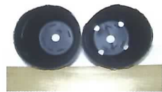
従来形（左）と改良形