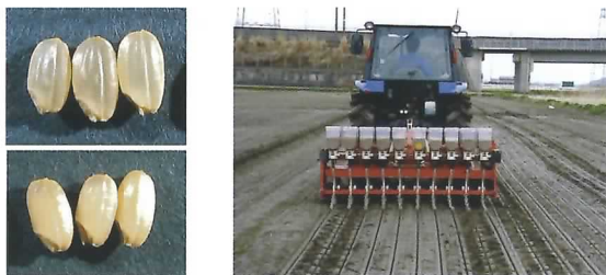
左上：健全粒 左下：障害粒 右：不耕起V溝直播

近年、夏の異常な高温によりコシヒカリの玄米が白く濁る品質低下が全国で問題となっています。農業総合試験場が開発した不耕起V溝直播で栽培すると、この品質低下を抑えられることが分かりました。品質向上のメカニズムを早急に解明して、愛知県産米のブランド化を図っていきます。（作物研究部）