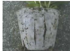
分解の進むポット

土壌中で分解する生分解性ポットが注目されています。花壇苗に利用しやすい耐久性や分解速度を備えたポットの素材や形状を明らかにしました。花壇用には、分解を早めるため澱粉を25%程度混合したものを使用し、すぐに根が伸びるように底の開口部を多く設けたものが適することが明らかになりました。（園芸研究部）